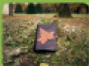
Les C&Wine de Laroche C&Wine Laroche